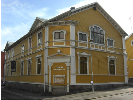
Yogahuset, Prästgårdsgatan 11, Piteå.